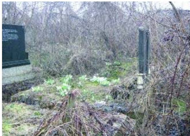
Висибаве на гробу

Запањен сам овим. Јер, прошлих година, када су људи кумили и молили да походе гробља, није им било дозвољено. Наводно, није безбедно, нико не залази. Можда има мина. А све време Албанци католици уредно су били сахрањивани на свом делу гробља. И лепо га одржавали. Мора се човек запитати где је одлутало хришћанско милосрђе.